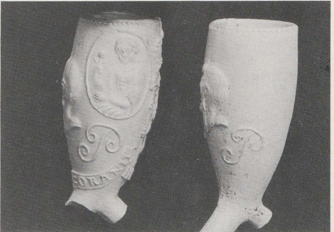
Afb. 1 rechts