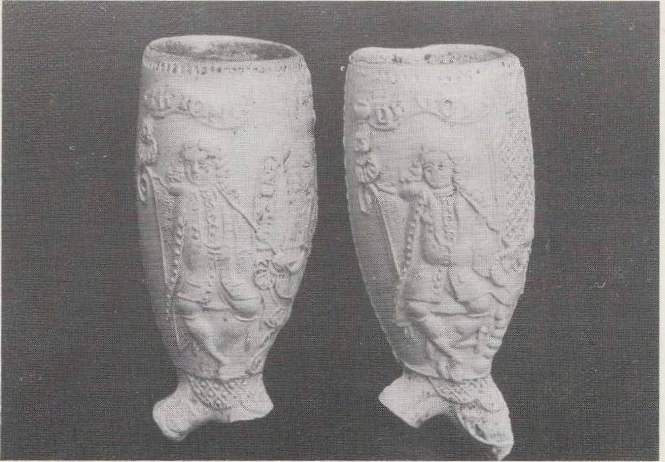
Afb. 2 links