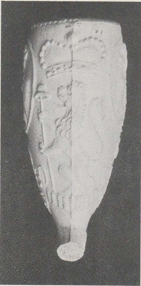
Afb. 1 achter

Rechts staat Wilhelmina van Pruisen (1751-1820) met een bloem. Eronder, dus ook onder de nar, staat VIVAT ORANIE. Aan de achterzijde voltooit de gekroonde Leeuw in de Hollandse Tuin deze pijpekop.