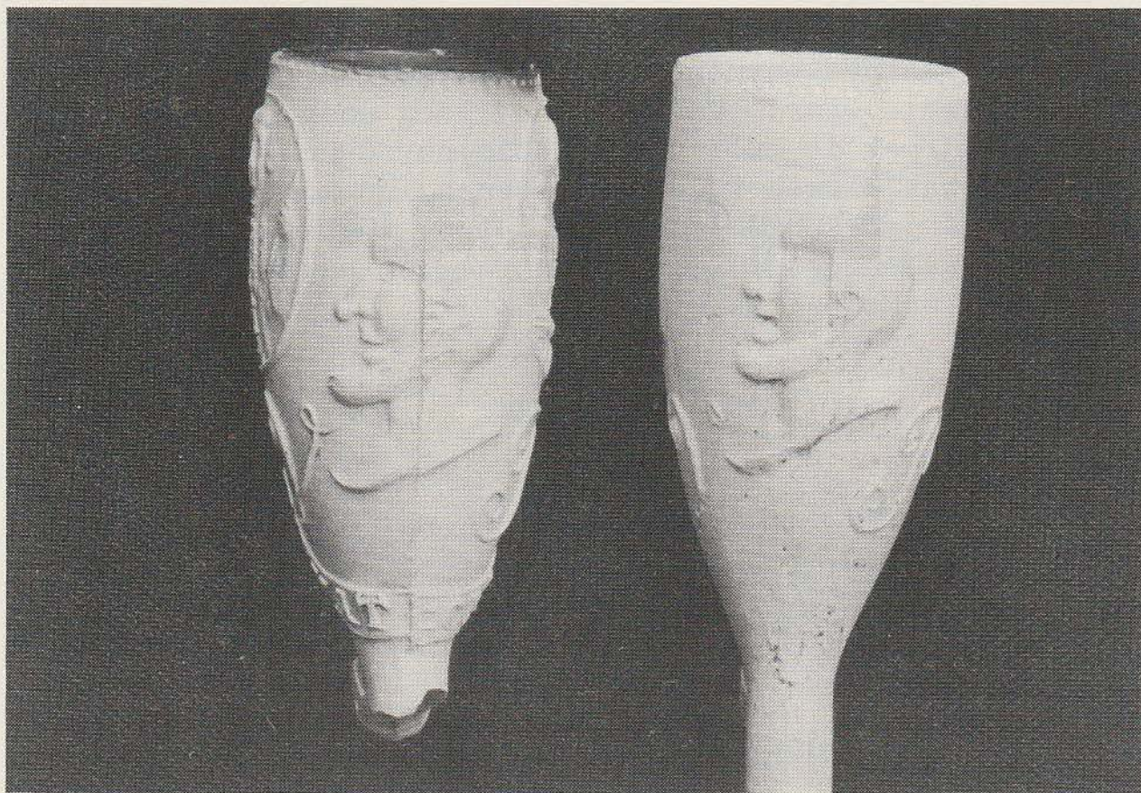
Afb. 1 voor

Op de linkerzijde wordt Willem V (1748-1806) afgebeeld met zijn commandostaf gevat in een medaillon.