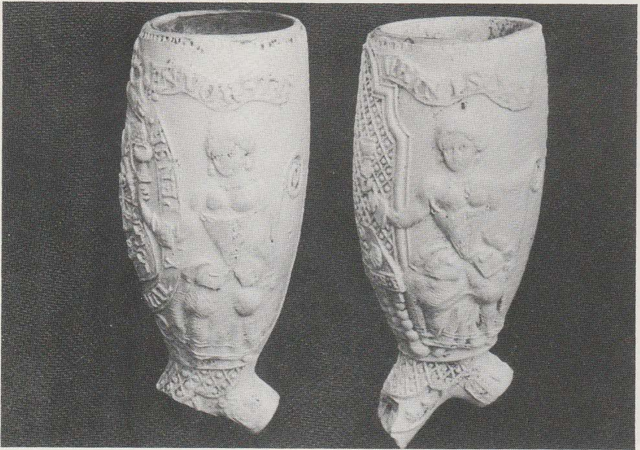
Afb. 2 rechts

waarmee Willem IV en Willem V dikwijls worden afgebeeld. Alsof de vervaardiger hiermee wil aangeven, dat met de rechterpijp toch een Oranjepijp bedoeld werd.