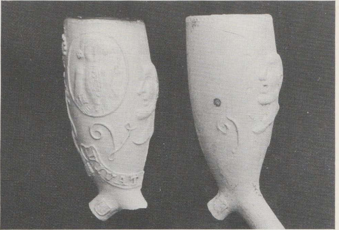
Afb. 1 links