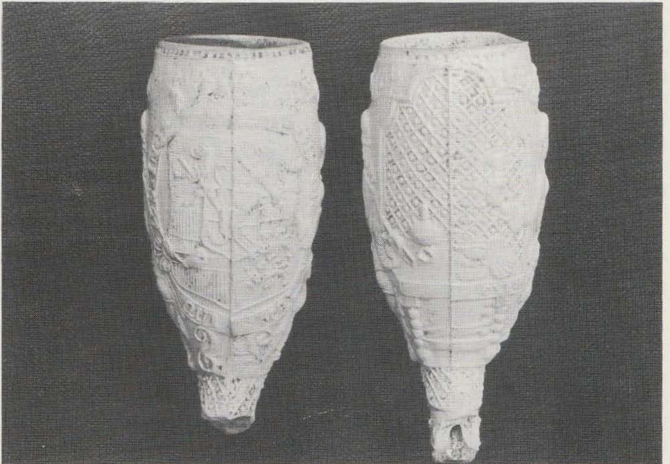
Afb. 2 voor